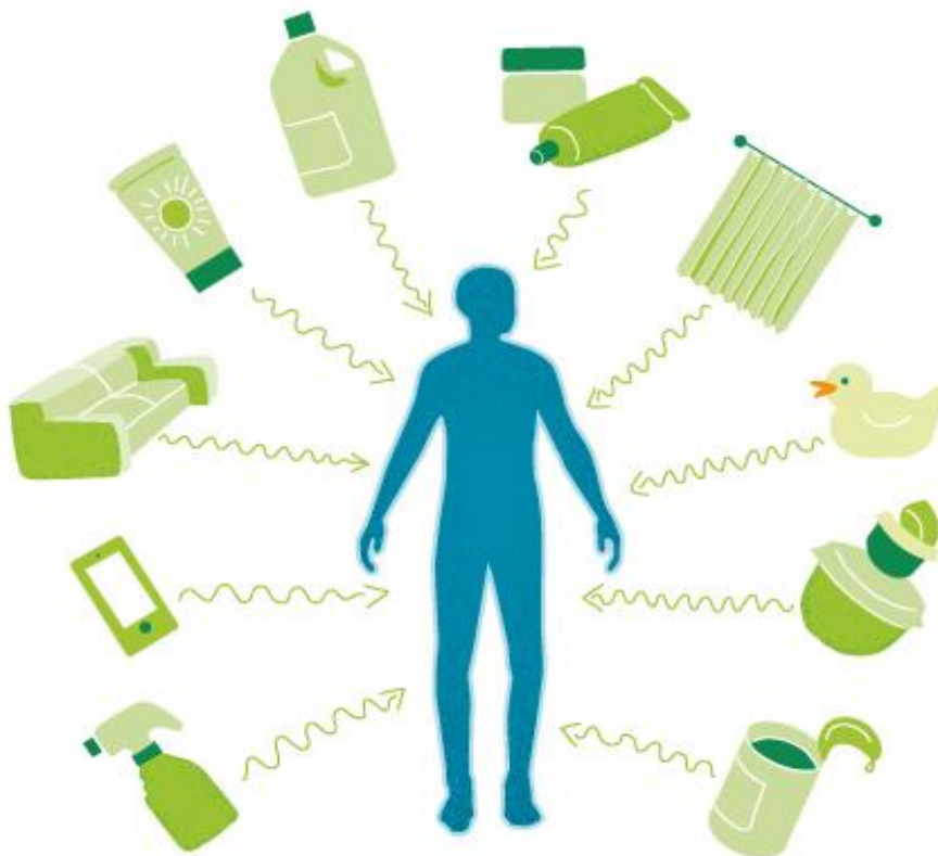
Afb. 2: Dagelijkse producten en voorwerpen waarin hormoonverstorende stoffen voorkomen.

DBP wordt gevonden in voedselverpakkingsmaterialen, speelgoed, bouwmaterialen, vloeren, meubels, wasmiddel, verf en lijm. Ook zit het in parfum, luchtverfrissers, computers, lampen, koelkasten, wasmachines, kleding, bestek, pannen en sierraden 7 .